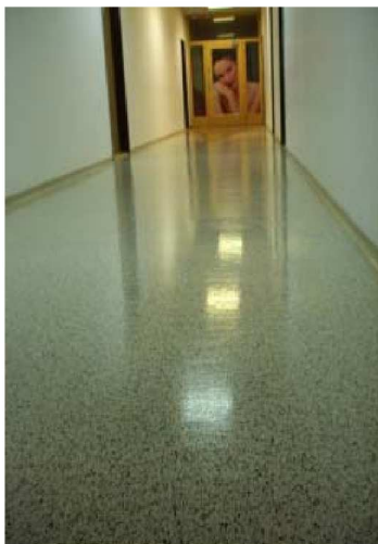
Po aplikaci !!!